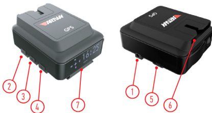
СХЕМА УСТРОЙСТВА И НАЗНАЧЕНИЕ КНОПОК